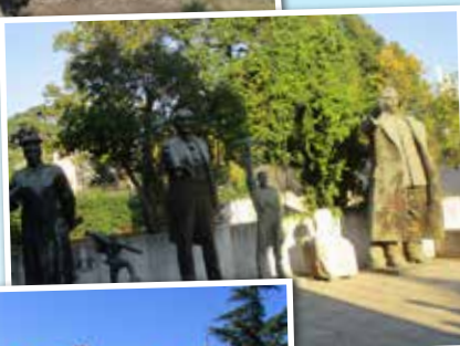
De gamle guder var gjømt bort - Lenin, Stalin og Hodza.