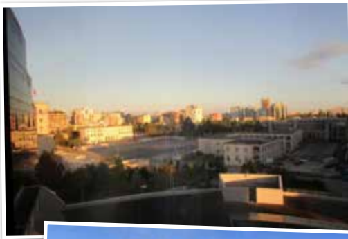
Tirana i morgensol.