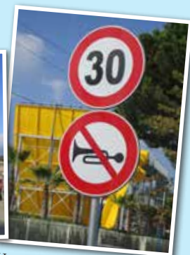
Utenfor hotellet i Tirana.