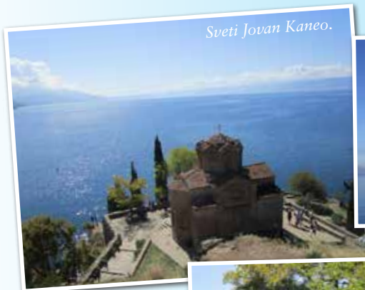
Sveti Jovan Kaneo.