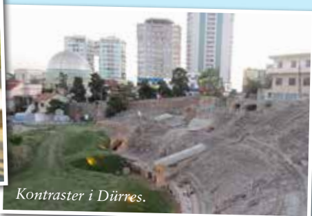
Kontraster i Dürres.