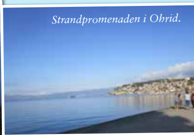
Strandpromenaden i Ohrid.