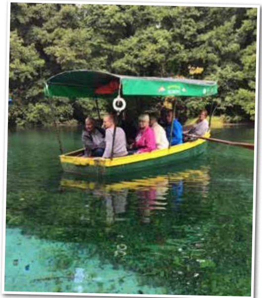
Magisk båttur på kilden Black Dream som forsyner Ohridsjøen med friskt vann.