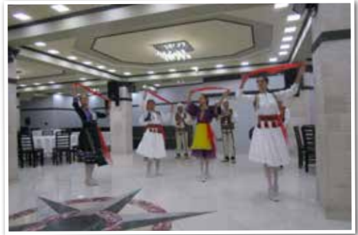
Albanske folkemusikere og -dansere.