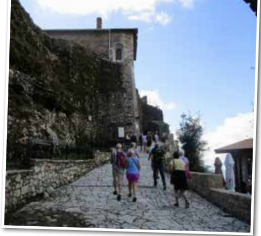
Festning med museum i Krujë.

Tirsdag gikk turen til Kallmeti-distriktet og en familiedrevet vin- og olivengård. Vi fikk prøvesmake på produktene, og med rikelig med ost og oliven og avsluttende raki var vi mørnet nok for å handle med oss eksemplarer hjem! Det var nesten overflødig med lunsj på restaurant Mrizi Zanave, men med enda flere nye opplevelser i både smak og mengde!